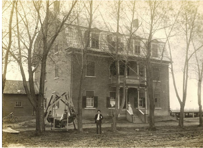
Maison Gélinau Rue Beauchemin (aujourd’hui rue Girouard)