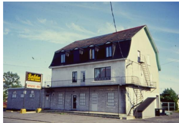
Hôtel Windsor 1266 rue Girouard, Marievalle